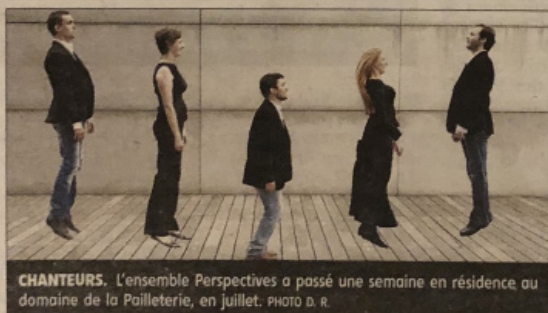
CHANTEURS. L'ensemble Perspectives a passé une semaine en résidence au domaine de la Pailleterie, en juillet.

Les mélomanes s'en souviennent, c'est avec cet ensemble