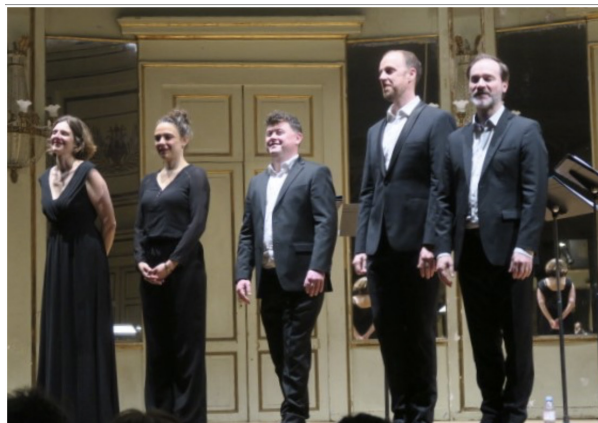
Salut final sous les applaudissements du public.

« Perspectives, ce sont cinq superbes voix parfaitement accordées qui explorent ensemble la musique vocale depuis 2011, sous la houlette de Geoffroy Heurard. Sans condition, sans exclusivité, sans barrières sauf celle de la qualité. Et celle-ci est au rendez vous lors de ce concert intitulé « Chants de misère et d'amour » qui propose un panorama de musiques sacrées allant de la Renaissance au contemporain. Le concert se termine (trop tôt !) avec la musique romantique et la salle, qui n'a pas applaudi, suspendue à cette musique sublime et transcendée par des interprètes inégalés, réserve un triomphe aux cinq solistes de Perspectives ». A.C. Chapuis