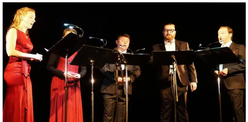
Cinq voix a cappella à Ligéria

Vendredi 25 février, le quintette vocal a cappella d'Ensemble Perspectives a proposé un concert à l'espace Ligéria, devant un public averti mais trop peu nombreux. Une performance vocale qui symbolise le chemin parcouru des artistes depuis une dizaine d'années. Les chanteurs ont exploré tous les styles de musique, avec des grands noms, dont Philip Lawson, Katarina Henryson, Purcell, Sting en passant par Maurice Ravel ou encore Charlie Chaplin. Un concert entre musique classique et musique populaire, ovationnée par les spectateurs.