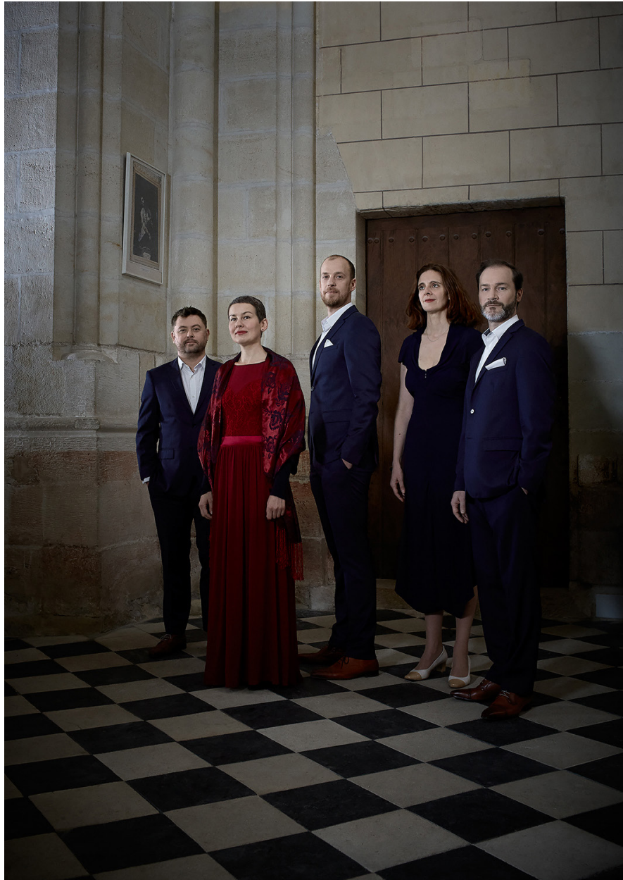
Collégiale Saint-Martin de Candes - avril 2019